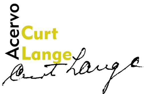
Figura 8 – Marca do ACL-UFGM

É importante observar que este guia trilingüe será distribuído para diversas instituições ligadas à pesquisa musicológica e à música em toda a América Latina, contribuindo de forma decisiva para a divulgação do acervo, de seu conteúdo, assim como das condições e serviços oferecidos à comunidade.