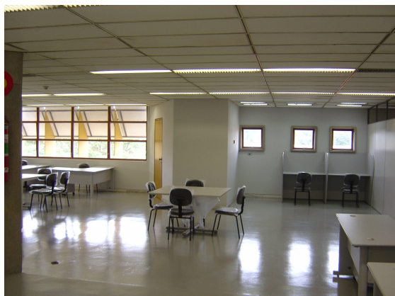
Figuras 2 e 3 – Vista parcial das novas instalações do ACL-UFMG em abril de 2005.

Paralelamente, foram iniciadas as atividades de conservação do acervo, coordenadas pelo conservador do CECOR-UFMG, Mário Sousa Junior. A vistoria técnica realizada nas atuais instalações verificou a necessidade de iniciar os trabalhos pelo tratamento da subsérie 8.1 – Fotografias, uma vez que a presença de traças em algumas das caixas evidenciava o perigo de destruição dos documentos, dado o alto grau de atração deste tipo de agente pela emulsão fotográfica. A subsérie 8.1 – Fotografias encontra-se em processo de limpeza