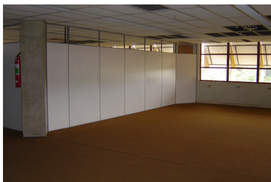
Figura 1 – Vista parcial das futuras instalações do ACL-UFMG em dezembro de 2005.

Em 26 de outubro de 2004, o projeto foi oficialmente apresentado à comunidade acadêmica da UFMG, em evento intitulado Seminário Perspectivas para o Acervo Curt Lange , realizado no auditório da Biblioteca Universitária, com a participação de representantes de diversas unidades ligadas à área de pesquisa e intercâmbio acadêmico, além de representantes de instituições ligadas à história do Acervo Curt Lange, como o BDMG Cultural, 1 a FUNDEP e o Arquivo Público Mineiro, além de discentes e funcionários da universidade.