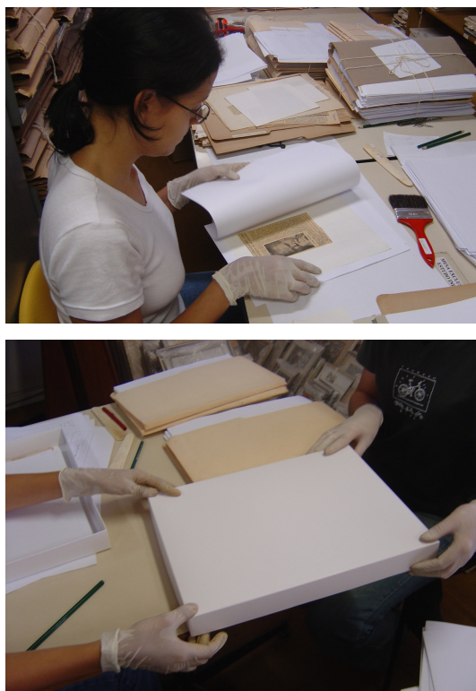
Figuras 6 e 7 – Tratamento da subsérie 10.10 – Recortes de Jornal

Até o momento foram tratadas e acondicionadas as subséries 9.2 – Documentos manuscritos de arquivos históricos, 10.3 – Estudos e transcrições de documentos e 10.10 – Recortes de imprensa (Figura 6), esta última encaminhada ao Arquivo Público Mineiro para microfilmagem.